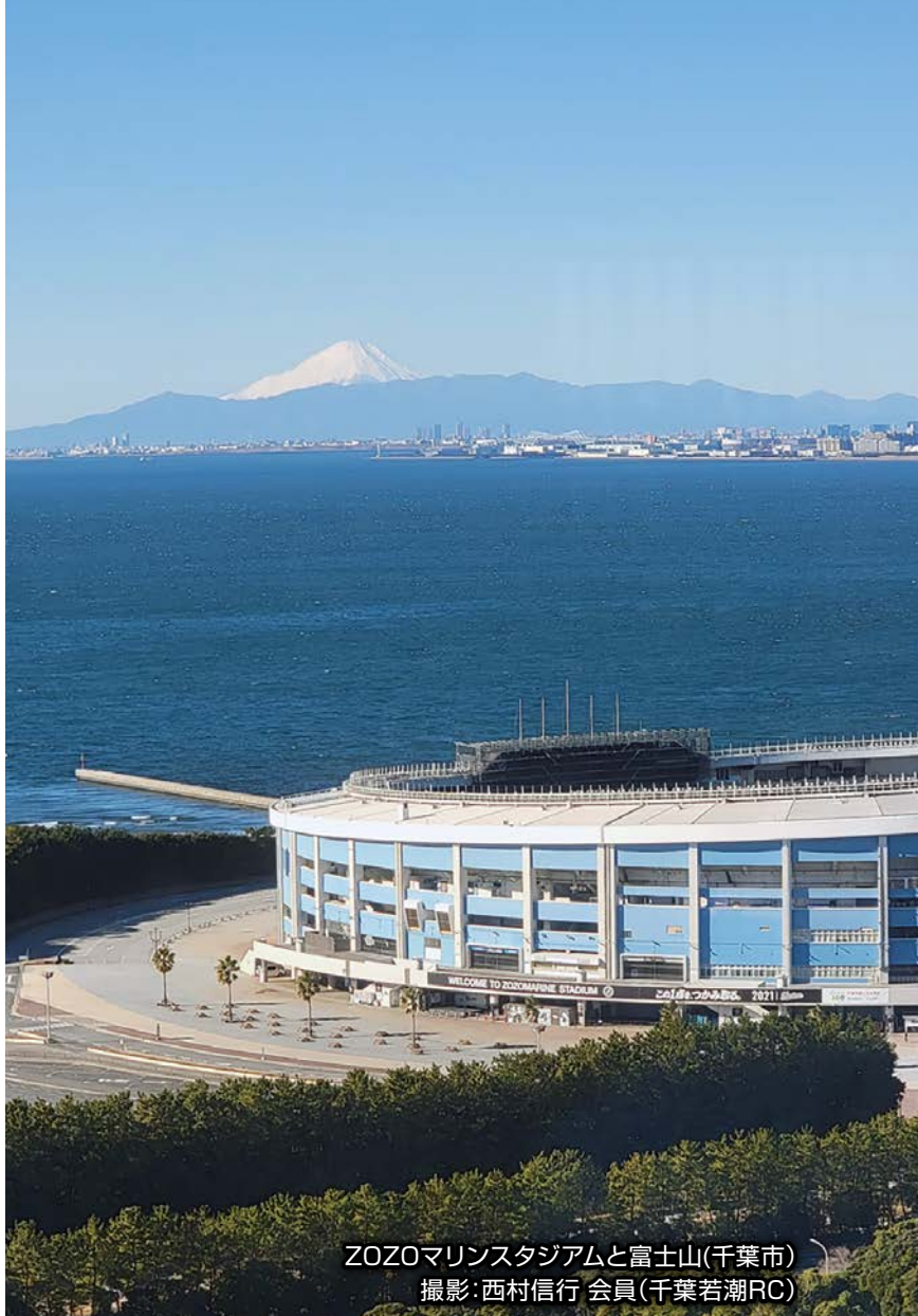
ZOZOマリンスタジアムと富士山(千葉市)

To Club Presidents Secretaries in District 2790 (CHIBA)