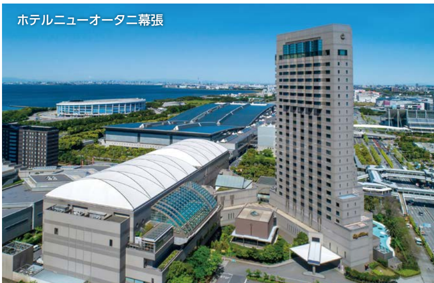
ホテルニューオータニ幕張